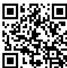
工作坊 google 報名表單