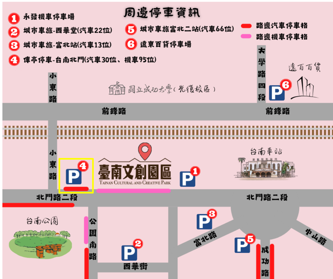
周邊停車場資訊 (收費標準請依停車場現場標示為主)