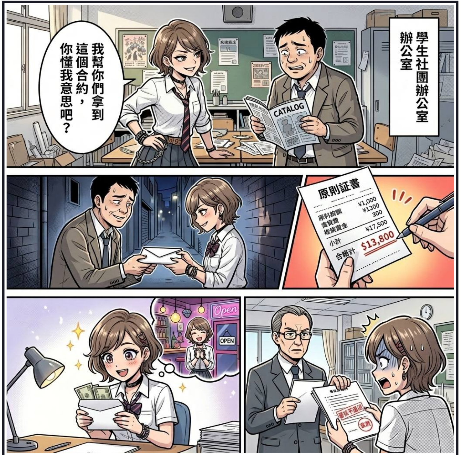
Case 02 - 熱血創業夢碎：收回扣的代價