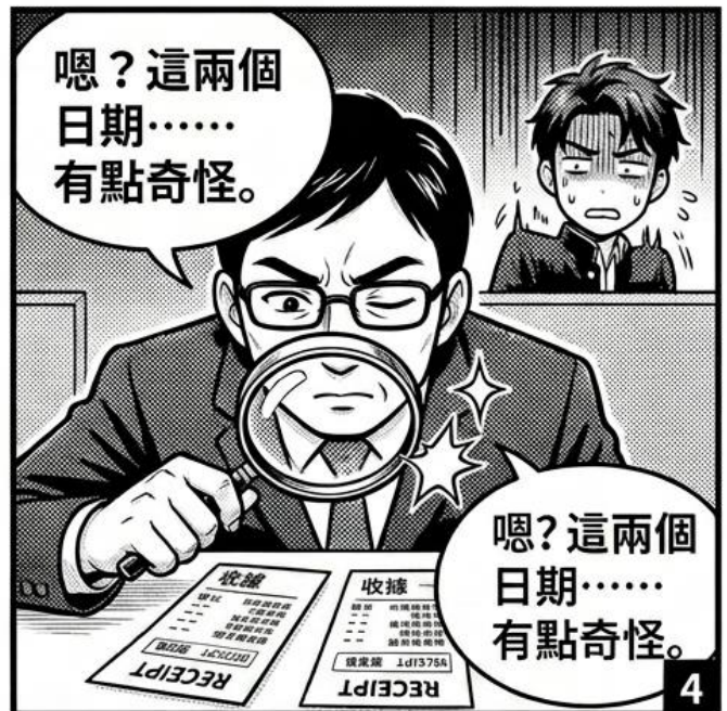
Case 03 - 小聰明大翻車：假講師真A錢