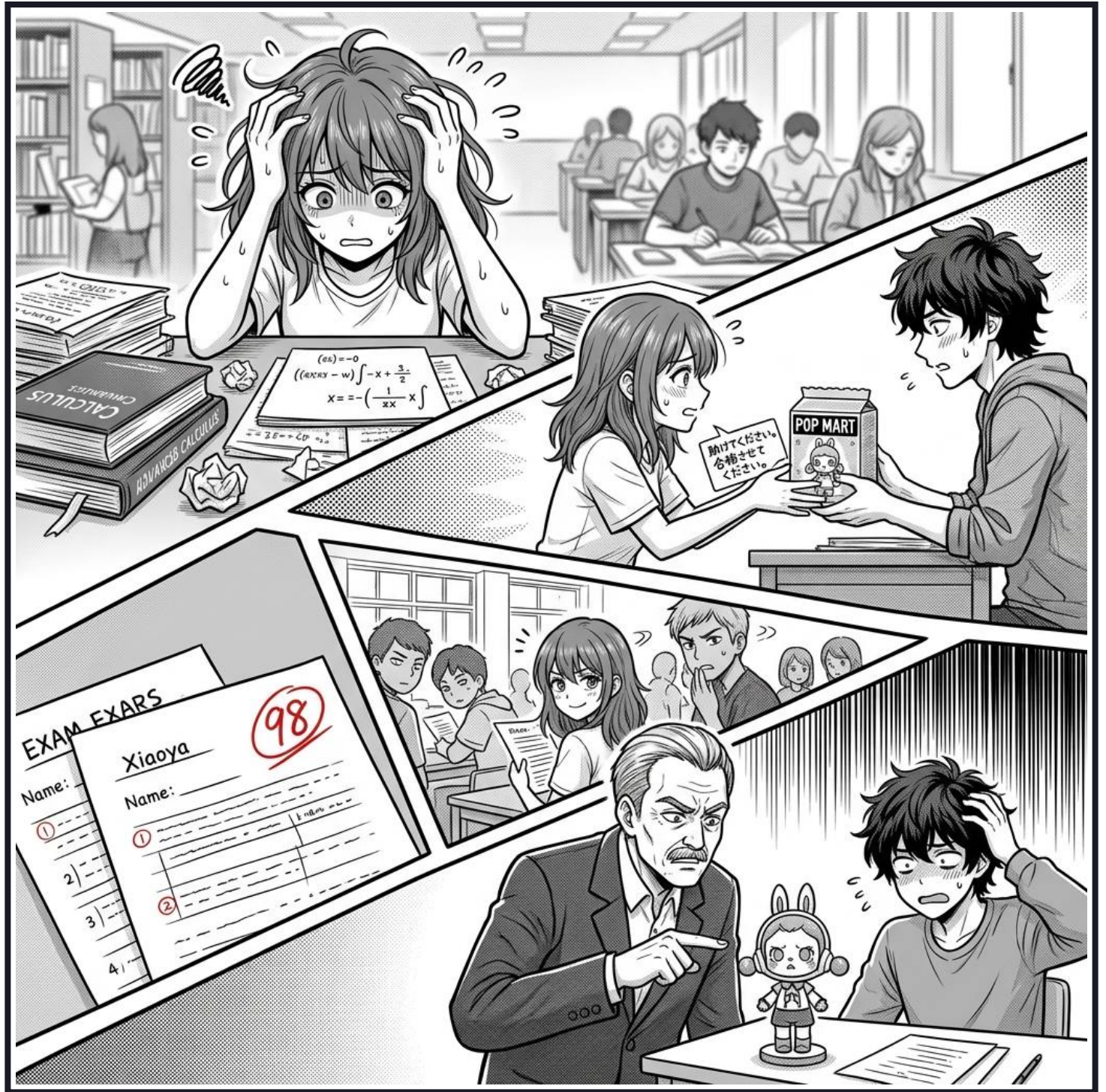
Case 04 - 微積分求生記：泡泡瑪特換高分？