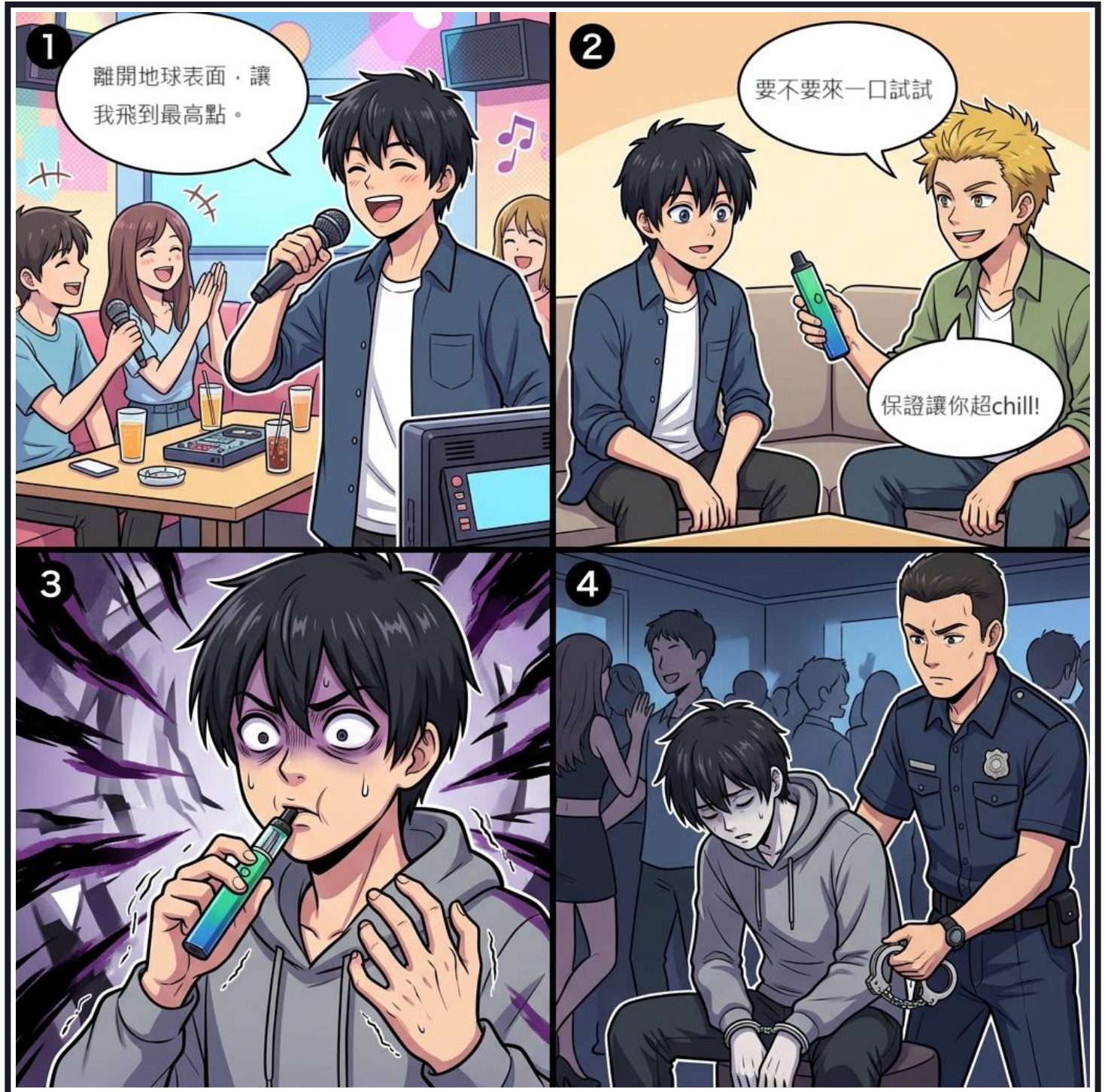
Case 06 - 一口入魂？誤吸「喪屍菸彈」