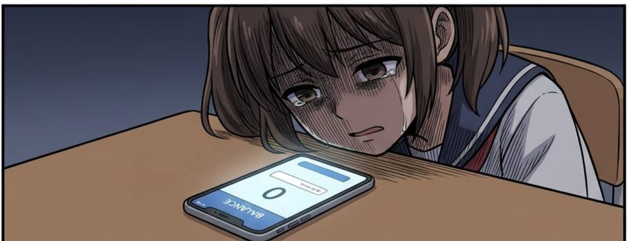
Case 07 - 天上掉下十萬塊？盲盒綠能詐騙