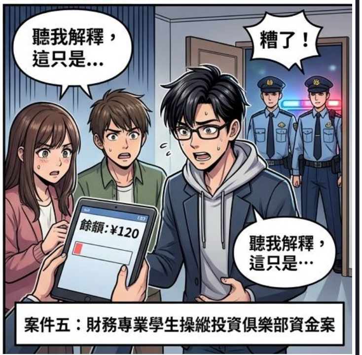
案件五：財務專業學生操縱投資俱樂部資金案