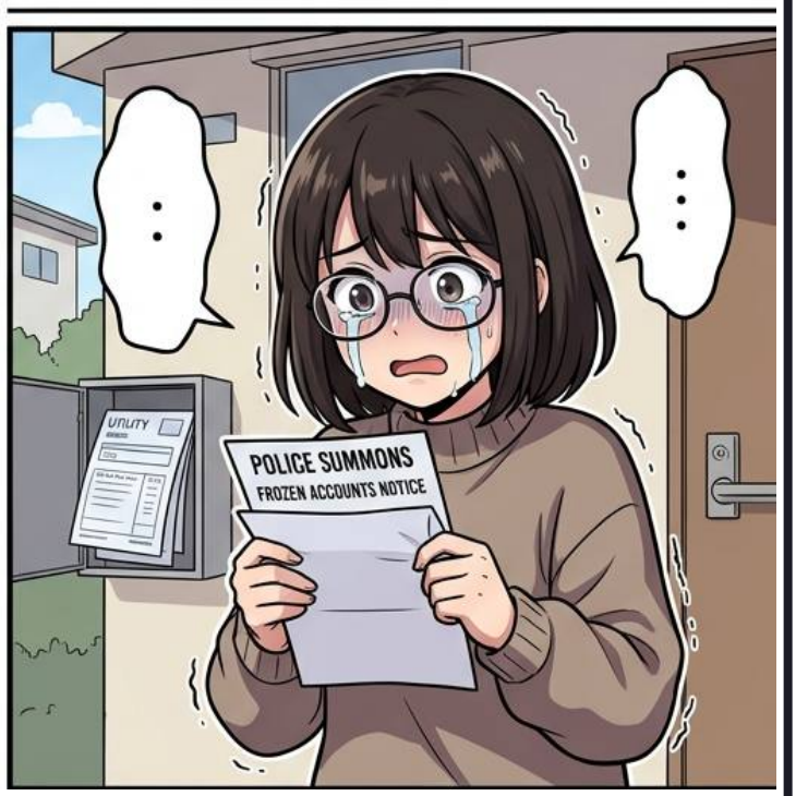
Case 08 - 想賺零用錢，卻變詐騙共犯？