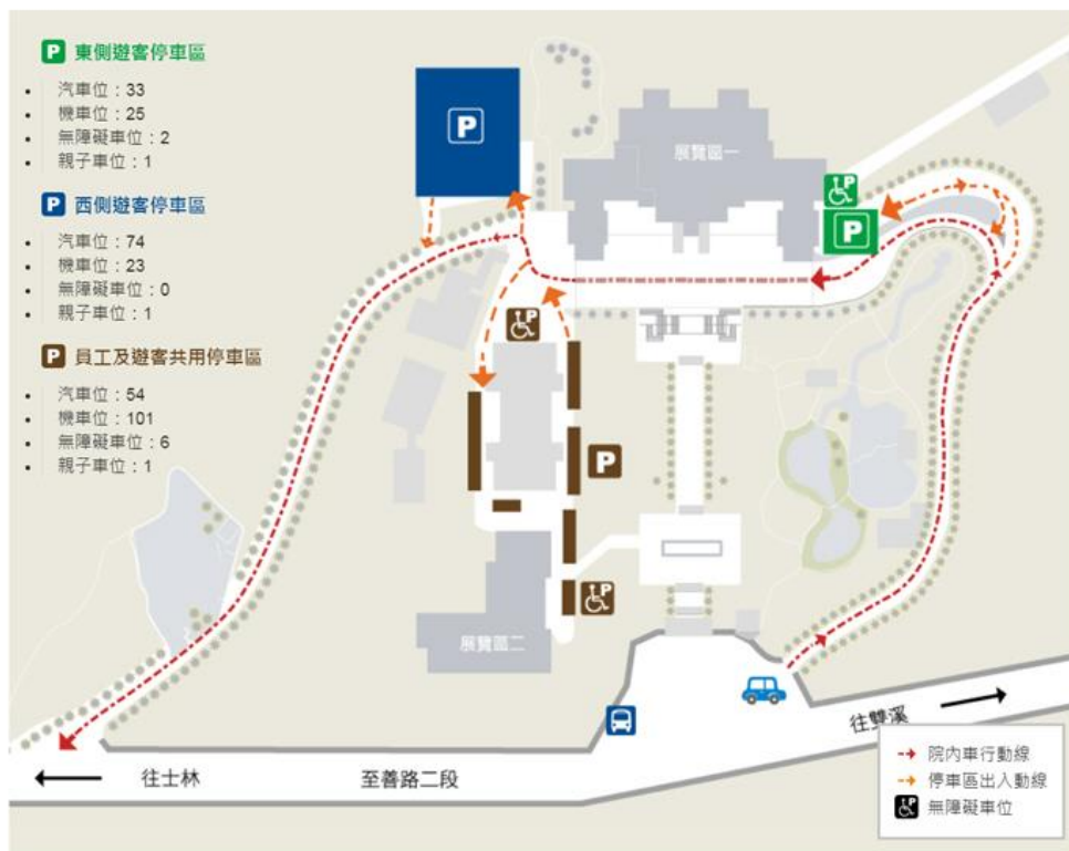
故宮院內遊客停車路線與位置圖